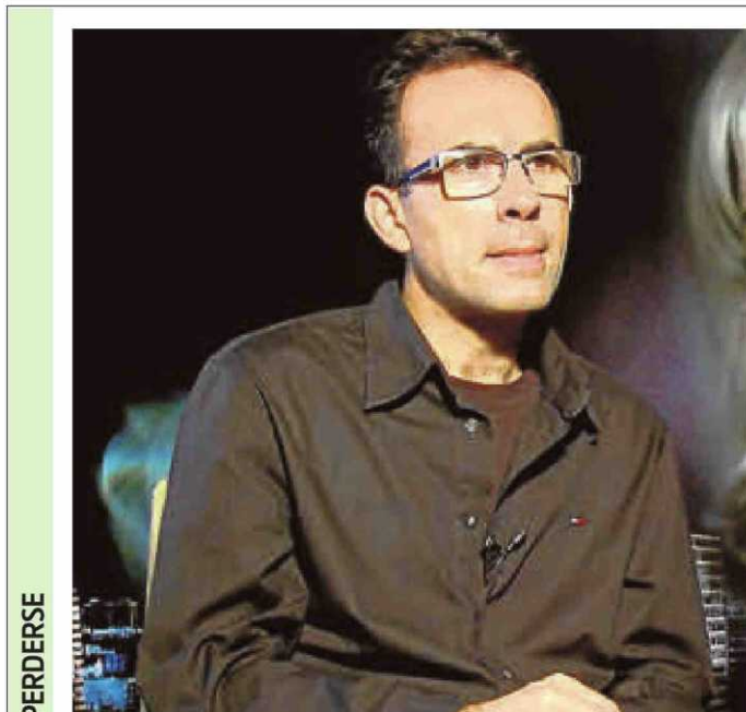
PARA NO PERDERSE

SEMANA DE LAS ARTES ESCÉNICAS CENTRO CULTURAL MIRALTORMES/ 18:30 H. Hasta el 10 de mayo: Como cada año por estas fechas el Consejo Social del Rollo celebra su Semana de Las Artes Escénicas, del 6 de mayo al 10 de mayo en el Centro Miraltor-