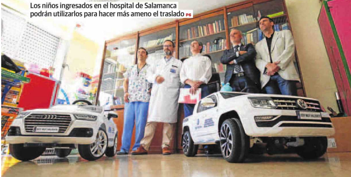
El presidente de Cruz Roja (en el centro), responsables del hospital y promotores de la iniciativa, en la presentación de los vehículos.

Los niños ingresados en el hospital de Salamanca podrán utilizarlos para hacer más ameno el traslado P6