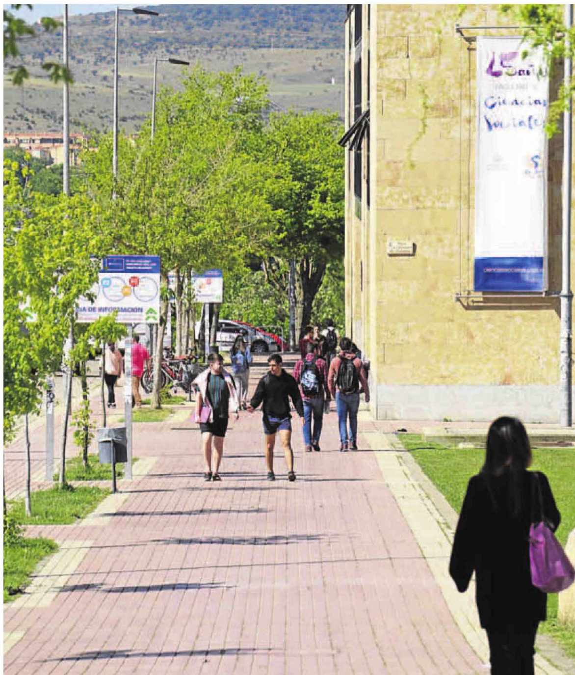
Estudiantes de la USAL en el Campus Unamuno.