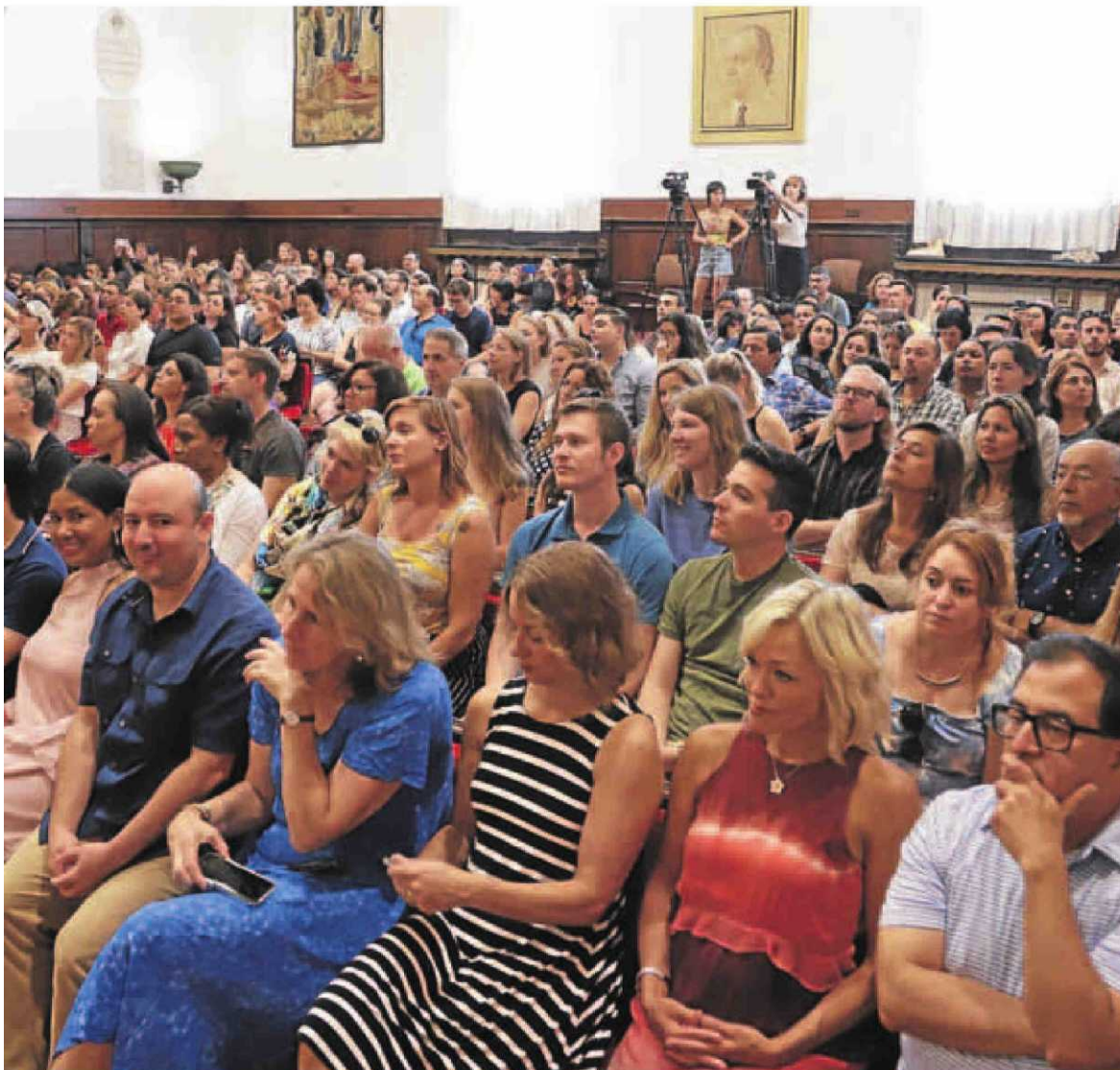
La inauguración de los Cursos Internacionales de Lengua y Cultura Españolas abarrotó de público el Paraninfo.