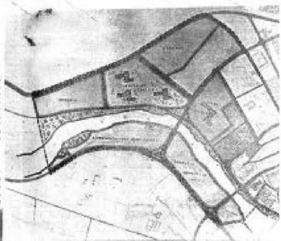
Como el plano de unido universitario que se hizo público, en el año 1969 de unido Salamanca...