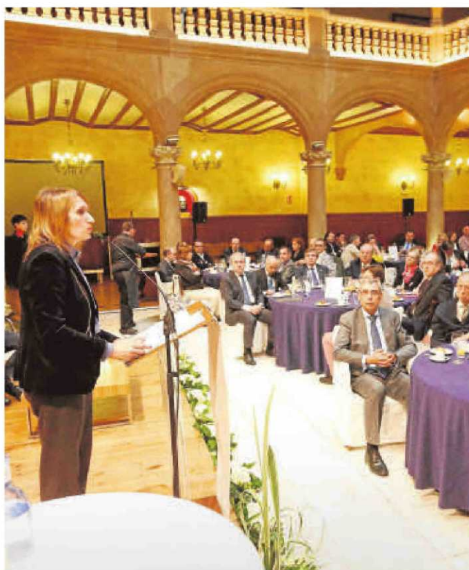
La consejera de Educación durante su intervención en el Foro GACETA.

Sánchez cambia ahora el programa electoral del PSOE para volver al plurinacionalismo