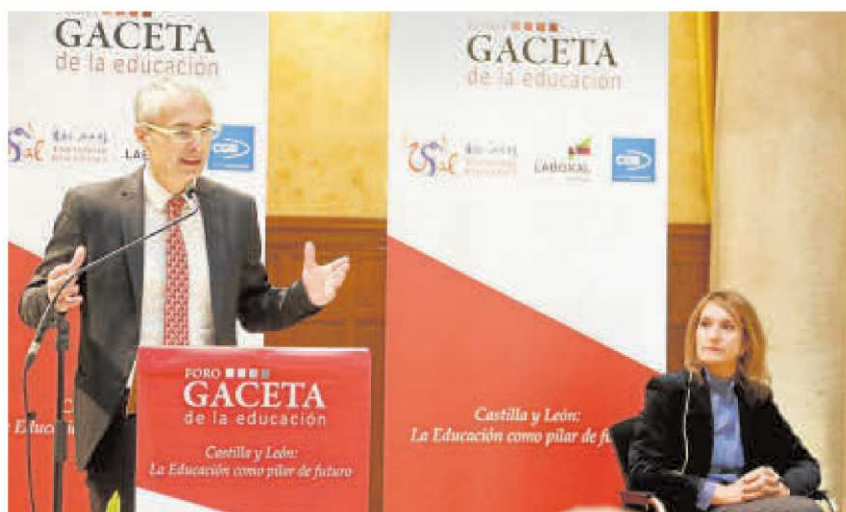
La consejera de Educación observa con atención al rector durante sus contundentes palabras.