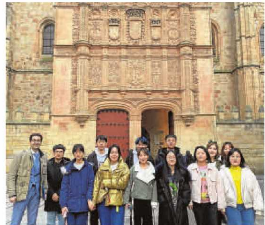
Estudiantes del nuevo curso intensivo de español para chinos.

En este sentido, la Universidad también ha llevado a cabo un cambio en su metodología docente y acaba de comenzar a impartir un nuevo modelo de curso intensivo para estudiantes chinos.