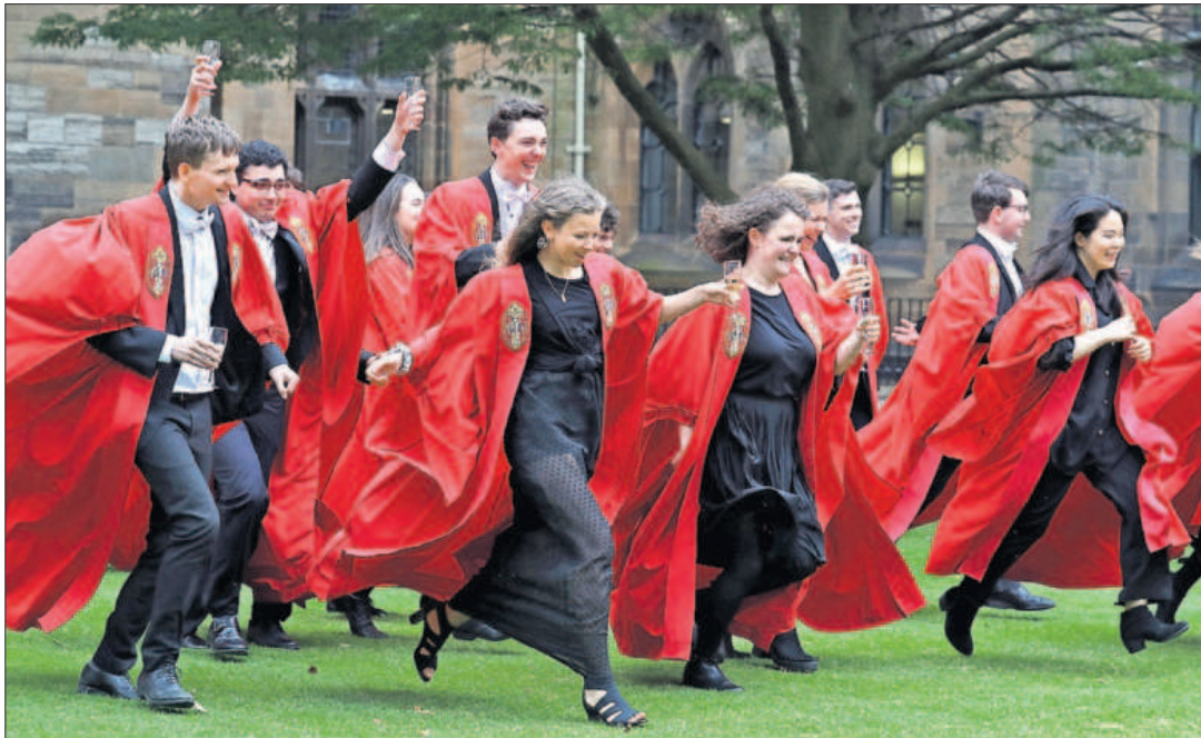
Ceremonia de graduación en la Universidad de Glasgow, en Escocia.

La matrícula cuesta 11.000 euros, salvo en Escocia donde vale 1.200