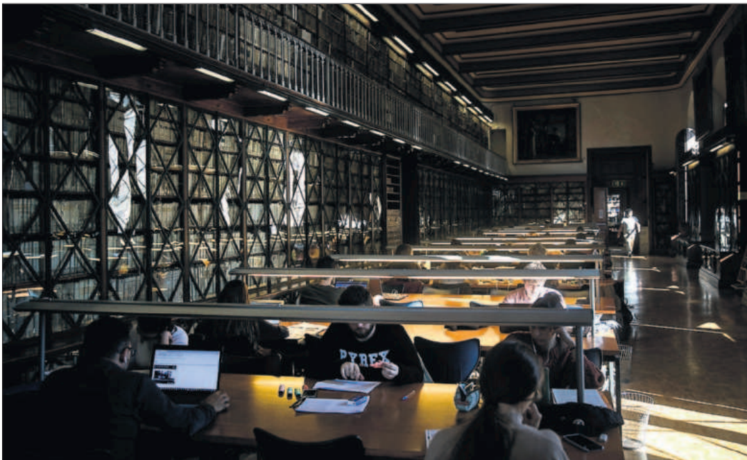
Alumnos en la biblioteca del edificio histórico de la Universidad de Barcelona, ayer.