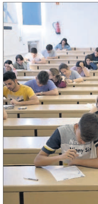
Prueba de Selectividad, en junio en la Universidad de Sevilla.