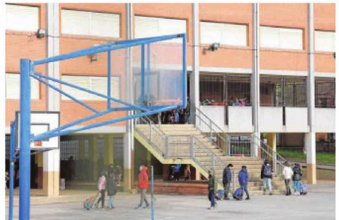
El Colegio Anduva, de Miranda de Ebro, cerró ayer sus puertas

A la espera de que se cierre el plan de contingencia, la consejera informó de que ha sido necesario incrementar de cuatro a ocho los puestos de especialistas encargados de atender los casos que llegan a través de 900 222 000, teléfono que desde su puesta en mar-