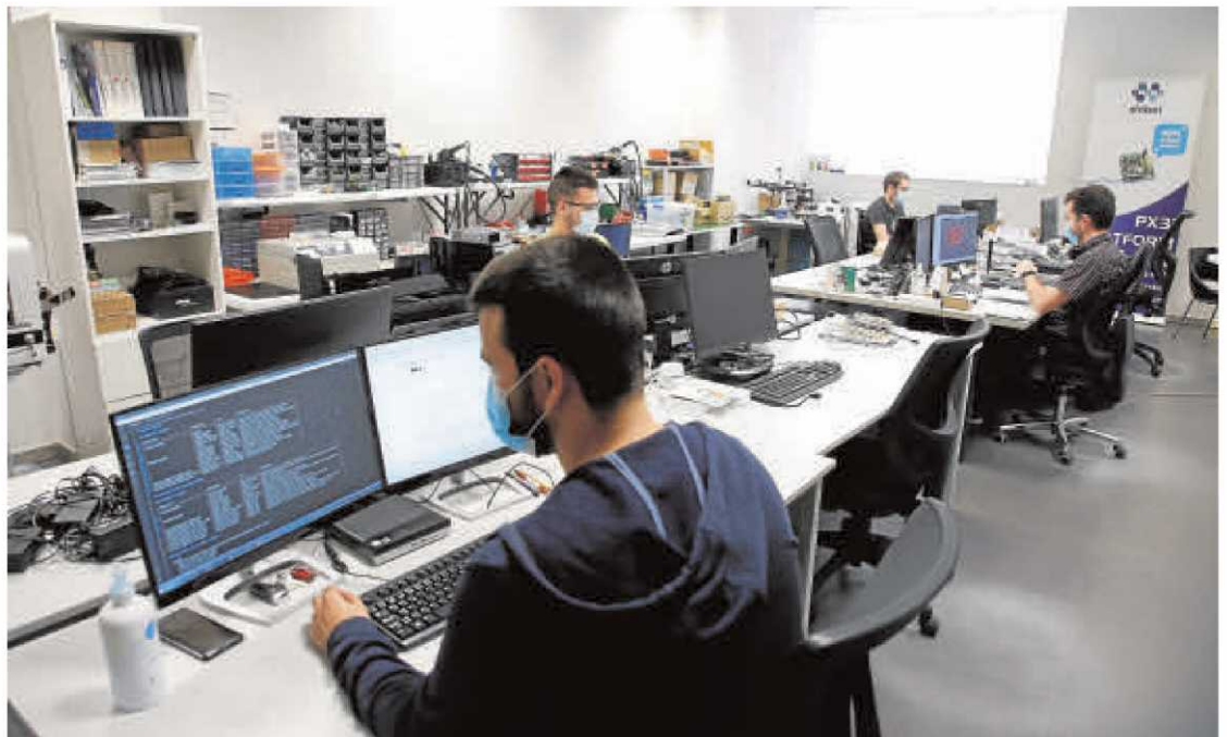
Un grupo de empleados, trabajando ayer en el Edificio M3 del Parque Científico de la Universidad de Salamanca. | ALMEIDA

Con la entrada de la provincia de Salamanca en la Fase 1 el pasado 25 de mayo, todos los espacios comunes han vuelto a abrirse y de nuevo están a disposición de todas las empresas. Esto ha implicado un gran trabajo y esfuerzo de planificación por parte de la dirección del Parque. En aras de mantener la seguridad e higiene de las instalaciones del Parque, siguiendo las recomendaciones marcadas por las autoridades y por el servicio de prevención de riesgos laborales, se ha diseñado un exhaustivo protocolo de actuación y reincorporación al puesto de trabajo, destinado a todas las personas que desarrollan su actividad en el Parque Científico. Así, se han creado itinerarios específicos de circulación en cada una de las plantas de los edificios del Parque Científico, para minimizar las situaciones de riesgo entre personas, también se han delimitado en el suelo marcas de separación