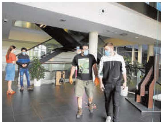
El uso de las mascarillas es obligatorio en el interior de los edificios.