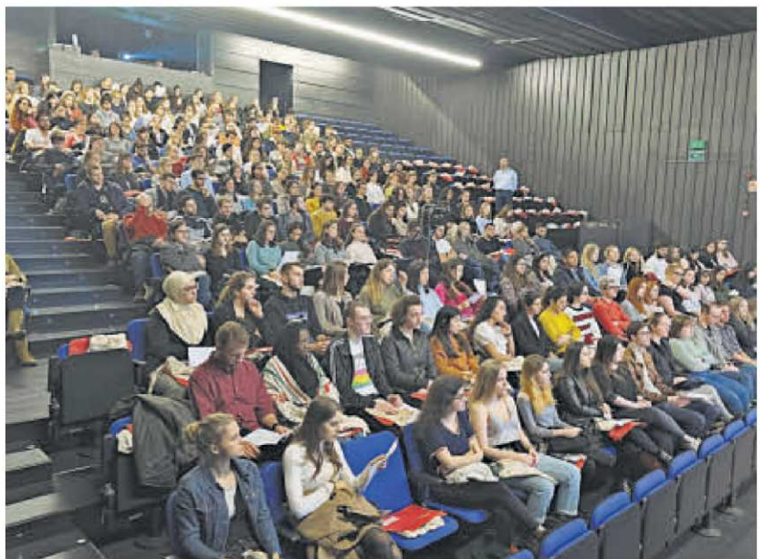
Un grupo de estudiantes internacionales en el acto de bienvenida del pasado año.