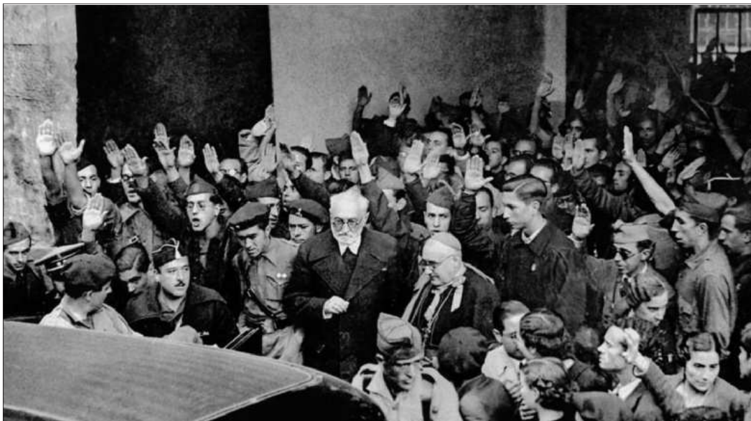
Miguel de Unamuno, a la salida del Paraninfo de la Universidad de Salamanca tras el enfrentamiento con Millán Astray en 1936.