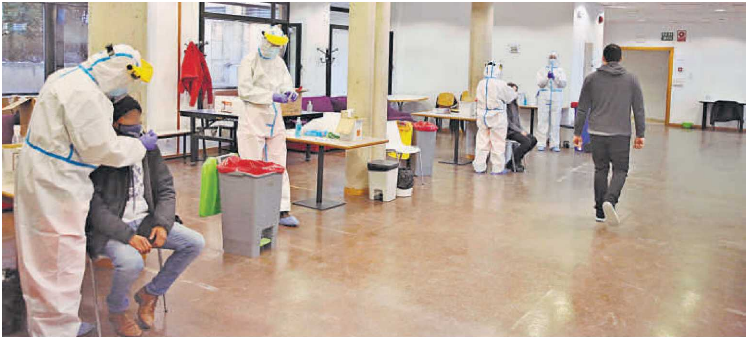
Momento del cribado realizado a los estudiantes del Colegio Mayor de Oviedo.