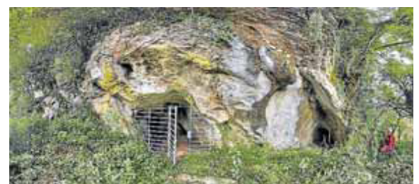
Entrada a la cueva de Aitzbitarte.

Su trabajo, realizado en esta ocasión sobre los grabados rupestres de Aitzbitarte V y publicado por la revista del Centro Superior de Investigaciones Científicas (CSIC), ha permitido identificar, por primera vez, “dos fases decorativas distintas”, separadas por 10.000 años, en una misma cueva de Euskadi. “Los dos periodos representados son el Gravetiense (hace unos 26.000 años) y el Magdaleniense (hace 14.000). En el primero se grabaron siete bisontes incompletos con las extremidades en un solo plano y con un cuerno unido a la frente y el otro a la giba”, explica Diego Garate, director del estudio y miembro del IIIPC. “En el segundo –agrega– se grabaron