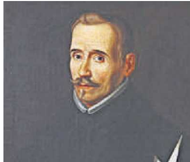
Retrato de Lope del Museo Lázaro Galdiano.