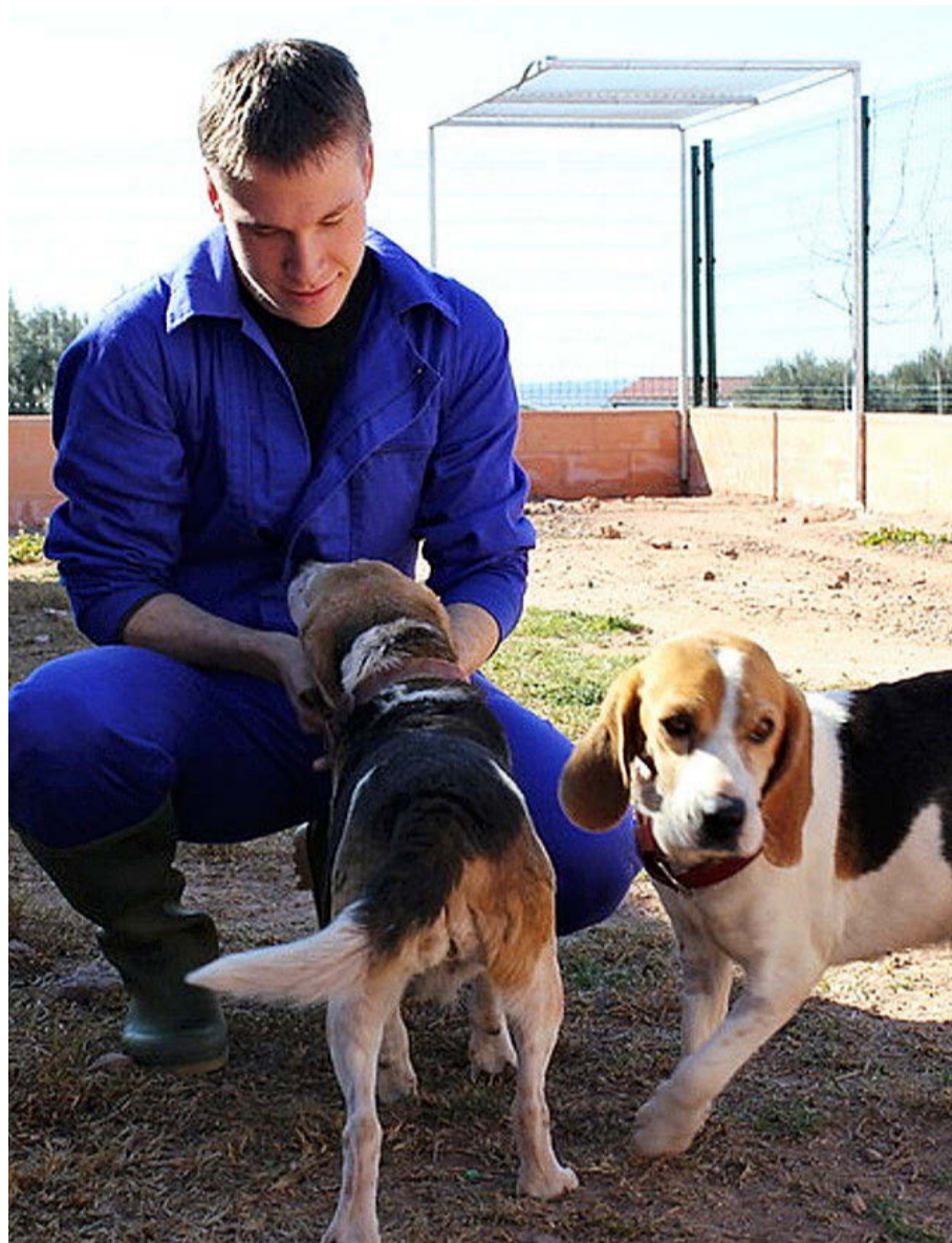
CEU CARDENAL HERRERA

Las prácticas en empresas son obligatorias y el estudiante debe cursar un mínimo de 6 ECTS. Cuenta con 86 empresas colaboradoras.