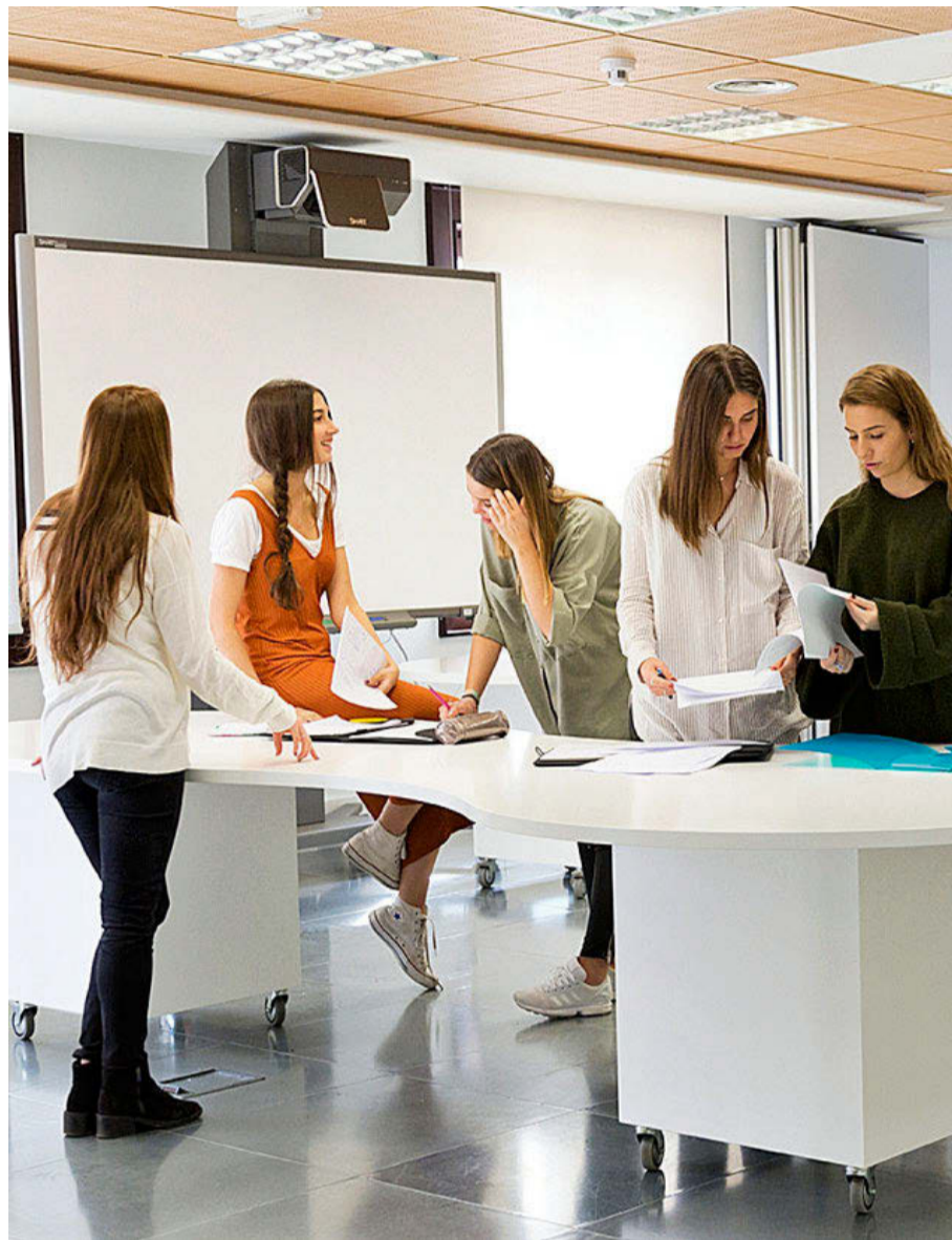
CAMILO JOSÉ CELA

Es reseñable la amplia oferta de estudios y la intensa actividad investigadora de esta Escuela. Cuenta con el sello EURACE.