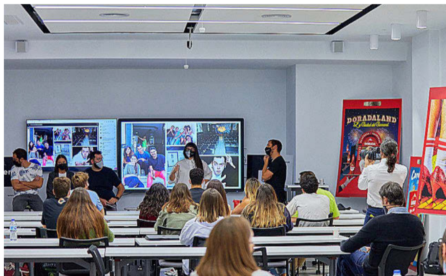
EUROPEA DE CANARIAS

Esta institución trata de diseñar títulos vinculados a las necesidades actuales de la sociedad como es el máster en Big Data & Business Analytics. En 2020 inauguró sus nuevas instalaciones en Santa Cruz de Tenerife: nueve aulas de última generación distribuidas en 1.400 m 2 que acogen las titulaciones del área de Ciencias Sociales.