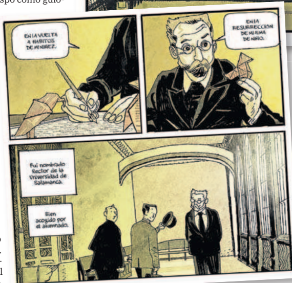
▲ Magnetismo. Los autores han buscado con las imágenes crear sensaciones en torno a Unamuno. A. ORBE Y B. CRESPO