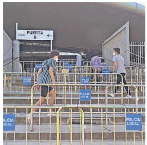
Estudiantes de Erasmus, durante la vacunación de ayer.