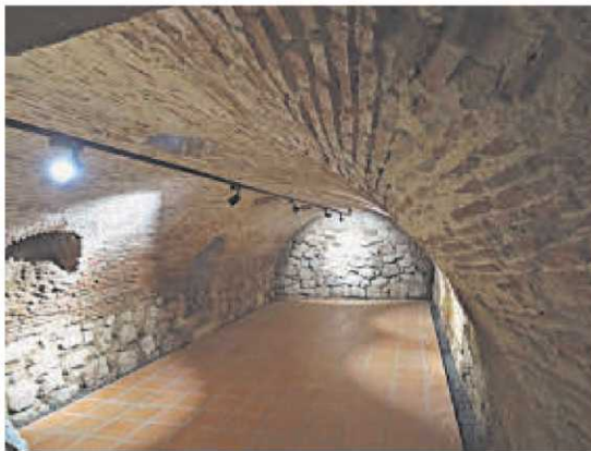
Sótano y bodega del colegio de la Magdalena.

El Estado, propietario del inmueble tras la desamortización,