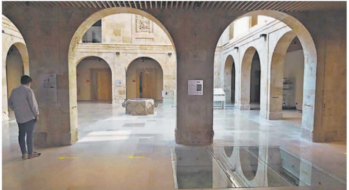
Claustro de la sede de Cursos Internacionales de la Universidad de Salamanca. | GUZÓN

Al adentrarse en las renovadas dependencias de Cursos Internacionales se pueden ver los diferentes paneles, con códigos QR incluidos, que permiten ir conociendo con detalle los restos históricos que perduran tras el paso de los años. También hay un plano indicativo que sitúa los restos que se conservan.