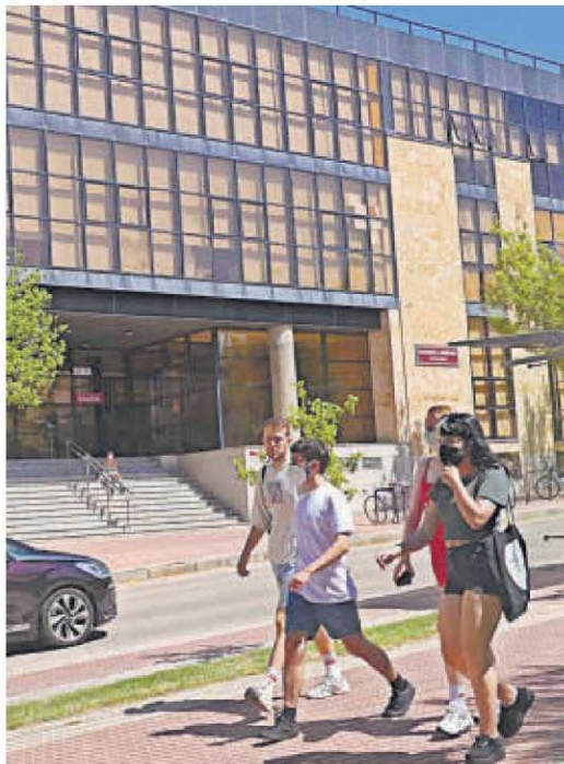
Estudiantes pasando por la Facultad de Derecho.