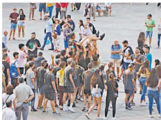
Estudiantes durante unas novatadas en 2019.

La futura ley sustituirá al antiguo Reglamento de Disciplina Académica firmado por Franco en el año 1954