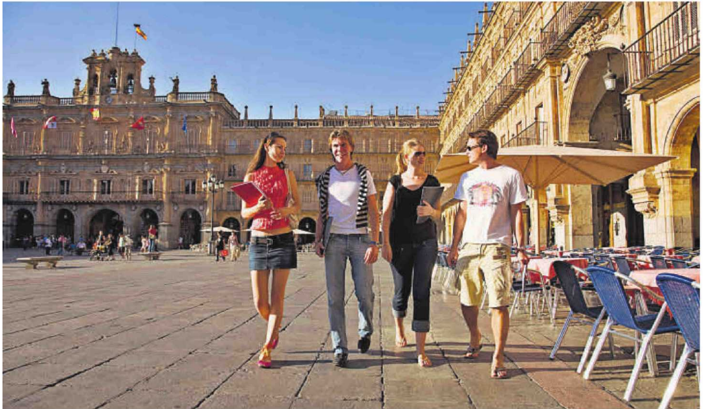
Cuatro estudiantes internacionales paseando por la Plaza Mayor de Salamanca.