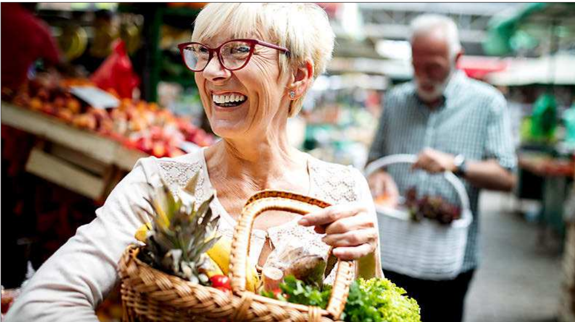
Impacto económico derivado del consumo de las generaciones mayores de 50 años.