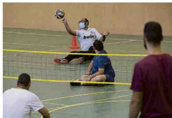
Un partido de voleibol sentado, en el pabellón del campus.

mán Álvarez, también estaba disfrutando —junto a diferentes autoridades de la USAL, directores de las escuelas del Campus Viriato y representantes de instituciones— de esta jornada deportiva. “Estas acti-