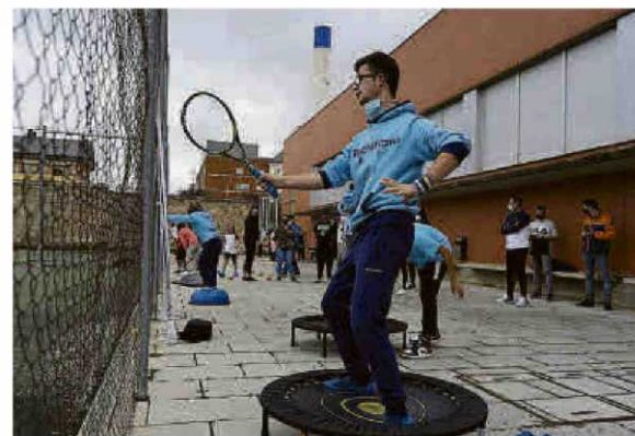
Un grupo de jóvenes practica ejercicios de tenis.

ta de esta sexta edición del Torneo Alumni. “Vemos que cada vez responde más gente y las actividades deportivas se multiplican. Además, se tiene en cuenta a determinados colectivos a los que, hasta ahora, no se les había prestado mucha atención. Nosotros queremos fomentar el deporte entre la gente, aunque tenga alguna dificultad o limitación. Con ello, reivindicamos que todo el mundo tiene derecho a participar”, subrayó.