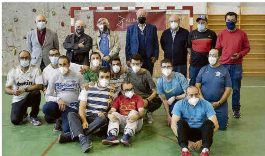
Vicente del Bosque (arriba, en el centro de pie) con autoridades y uno de los equipos participantes.