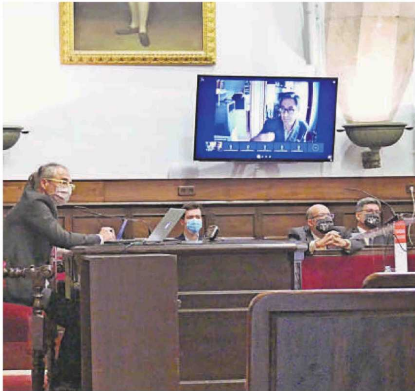
El rector con algunos miembros de su equipo y un representante de estudiantes.

En cuanto a las decisiones aprobadas en el órgano de gobierno del Estudio, el rector destacó los acuerdos para sacar adelante el que será el primer máster del "supercampus" europeo, así como las titulaciones de la Escuela de Policía para su transformación en centro adscrito. Además, se dio el visto bueno al nuevo plan de estudios del grado en Medicina.