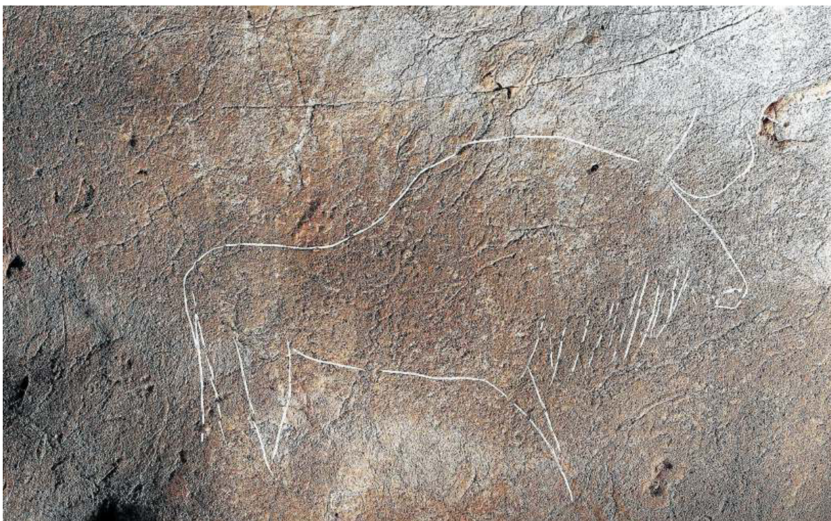
Uno de los grabados encontrados en la cueva Alkerdi 2.