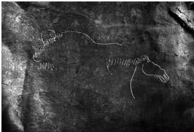
El grabado de un caballo, con las líneas resaltadas.

Esa es nuestra hipótesis, que el arte paleolítico se aprendía, y que en ese periodo la tendencia era hacer los animales así. Los artistas seguían esos modelos y los imitaban. Y le daban ese toque original.