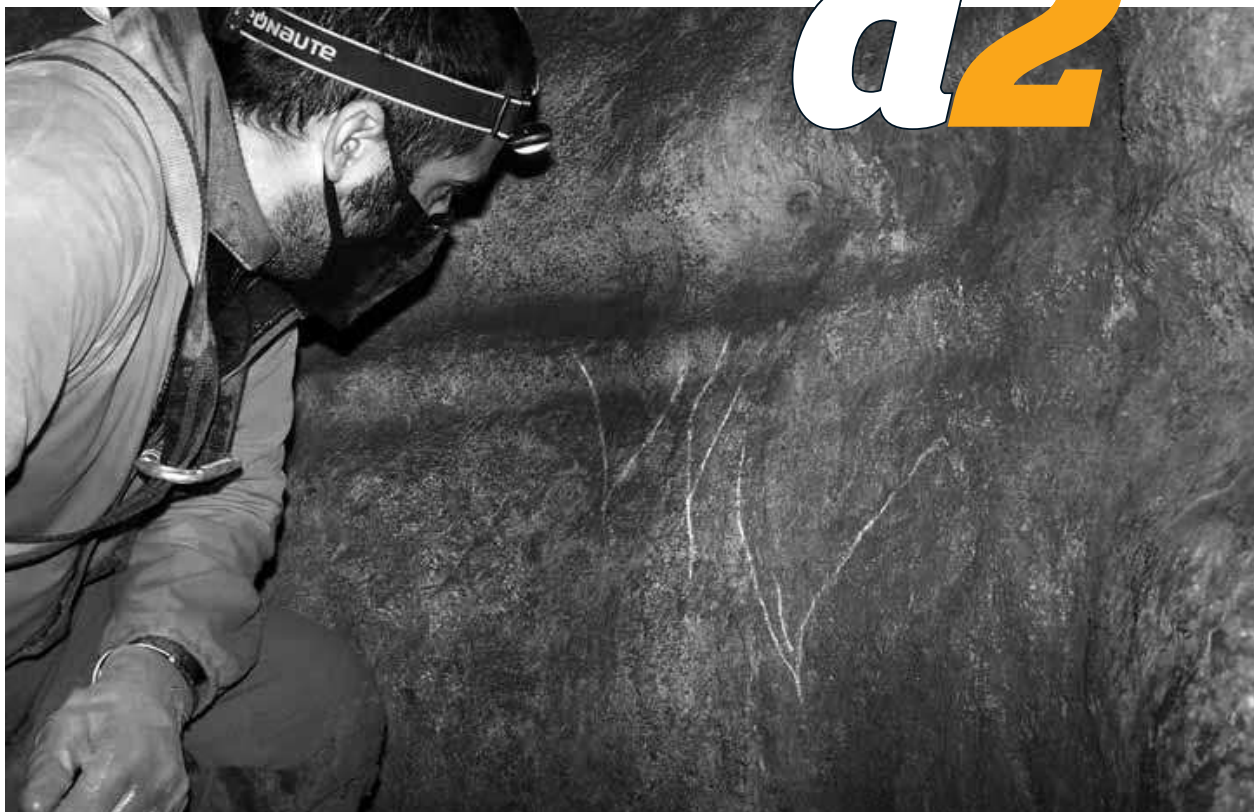
Uno de los investigadores contempla uno de los dibujos hallados en el interior de la cueva Alkerdi II.