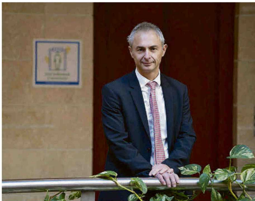
El rector de la USAL, durante su última visita al Campus Viriato. | Jose Luis Fernández

“En cuanto a investigación, nos hemos comprometido con la dirección de la Escuela Politécnica en una inversión para mejorar los equipamientos y sus laboratorios”