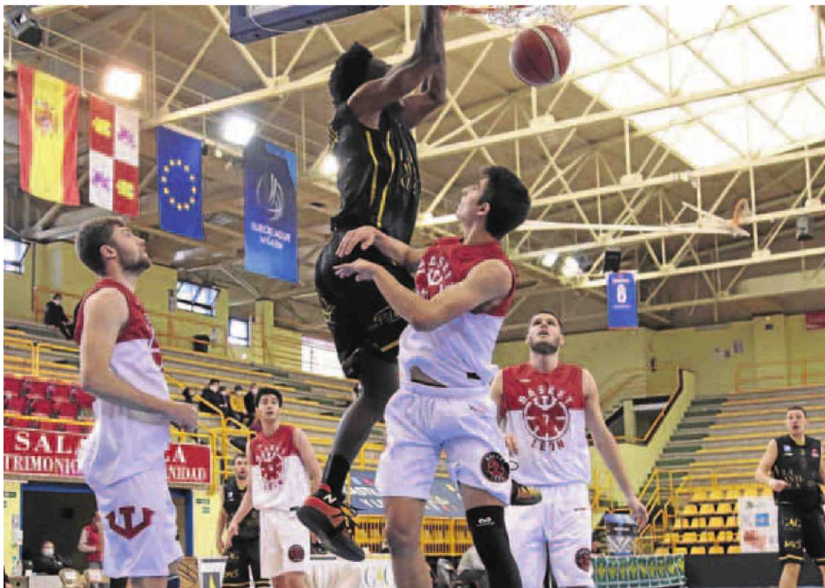
Espectacular mate de Yengue, del Usal La Antigua, ante el ULE Basket León en Würzburg. ÁLEX LÓPEZ