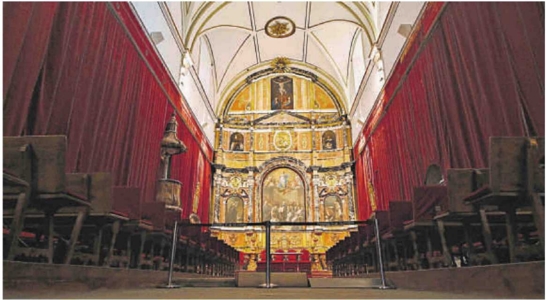
Capilla, del siglo XVIII, que cuenta con un sencillo pero elegante retablo y un órgano que data del siglo XVII.

La escalera de acceso al piso alto es otro de los atractivos del histórico edificio. Se trata de una joya del renacimiento español y tiene una particular simbología. Sus tres tramos representan las tres etapas de la vida del hombre: juventud, madurez y senectud y el ascenso de éste hacia a la perfección moral y espiritual, atravesando los peligros de cada una de las etapas.