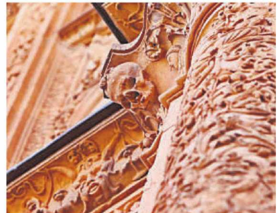
La famosa rana que se puede encontrar en la fachada.