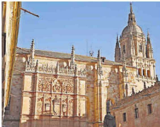
Fachada de la Universidad de Salamanca.