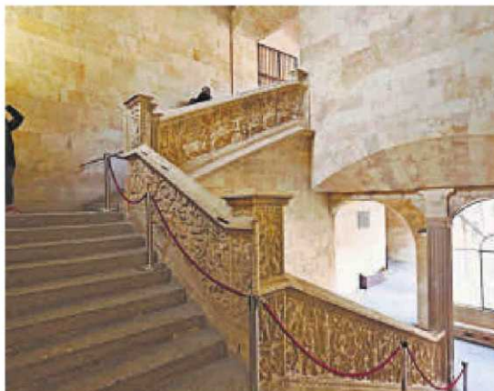
La escalera de acceso al segundo piso del edificio.