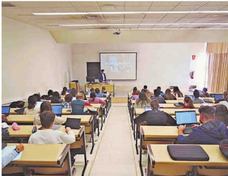
Estudiantes en un aula de la Facultad de Derecho de la Universidad de Salamanca. | LAYA

Los números recogidos por la Junta de Castilla y León también reflejan el "tirón" que tienen los estudios de Ciencias de la Salud, con más de 30.000 alumnos en la Región. La de Salamanca se posiciona como la institución académica de referencia en este ámbito, pues cuenta con 4.517 estudiantes, 1.000 más que la Universidad de Valladolid. Asimismo, la