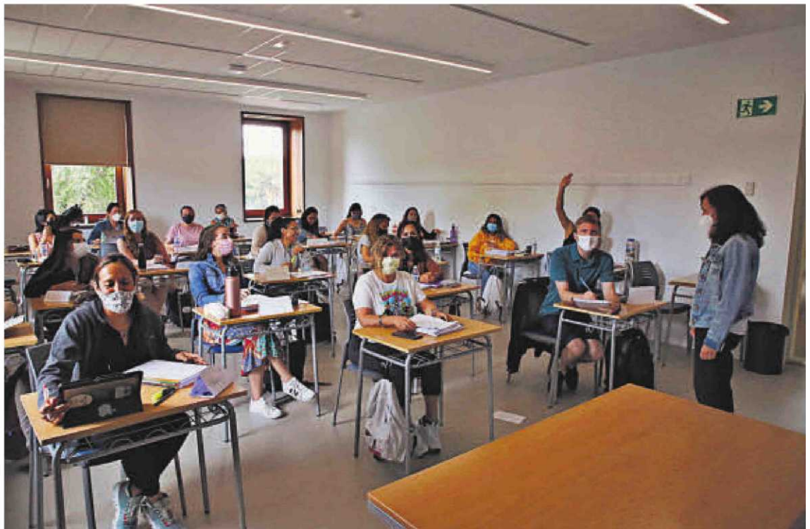
Estudiantes de español el pasado verano en los programas formativos de Cursos Internacionales de la Universidad.

Pero la incertidumbre se mantiene. “Para julio ahora mismo tenemos una indefinición total porque la matriculación se realiza al límite”, comenta el consejero delegado de Cursos y subraya la importancia de los grupos de profesores gracias al máster que tradicionalmente ofrecen para los docentes americanos y otros cinco cursos más. Además, la Junta también concederá becas, de manera que la estimación es que en