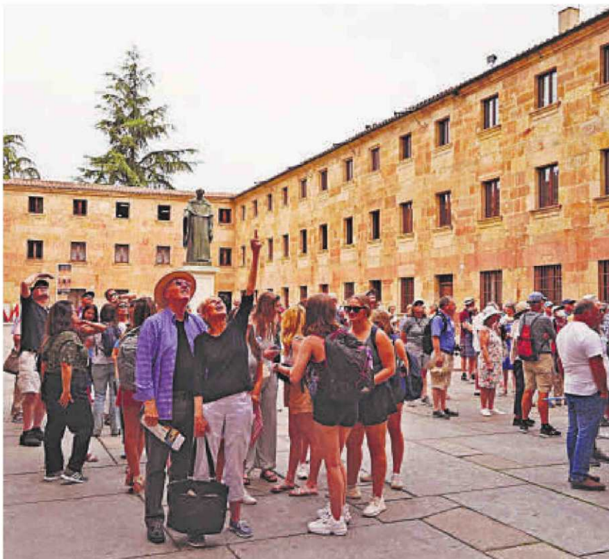
Grupos de turistas extranjeros durante este fin de semana en Salamanca.

La recuperación del mercado internacional se refleja también en los Cursos de Especialización en Derecho que organiza la Fundación General de la Universidad de Salamanca. "La próxima edición que comenzará el 1 de junio, al igual que la que ya celebramos en enero de este año, tienen un significado muy especial para nosotros, no solo por tratarse de un evento formativo de referencia en el ámbito del Derecho en toda Iberoamérica, sino también porque representan la vuelta a la normalidad