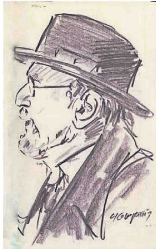
Karra Elejalde como Unamuno bajo el lápiz de Miguel Elías.