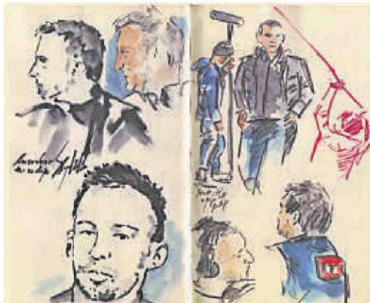
Alejandro Amenábar, en plenas tareas de dirección.