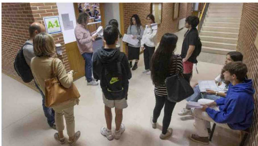
Los alumnos empiezan el examen y, abajo, aguardan su turno para entrar.