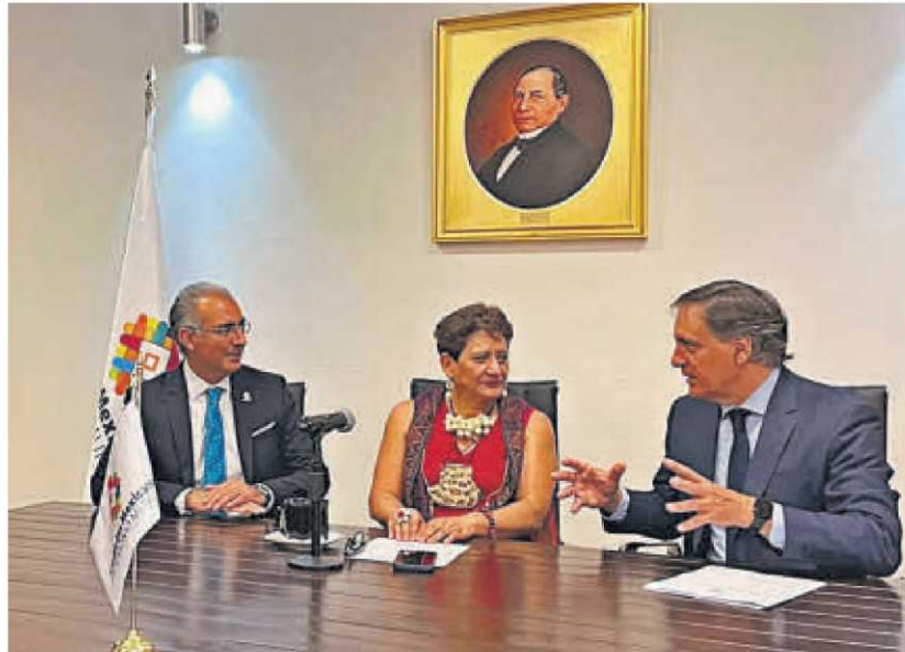
Carbayo conversa con la presidenta de la Asociación Nacional de Ciudades Mexicanas Patrimonio Mundial.