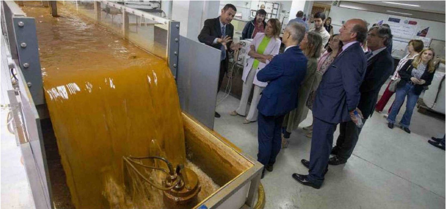
El director del grupo IGA explica durante la visita de la consejera y el rector los detalles de las infraestructuras que emplean en su labor de investigación.