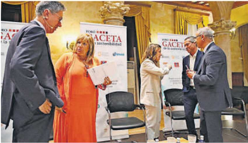
Los ponentes del Foro GACETA dialogan momentos antes del inicio. | ALMEIDA