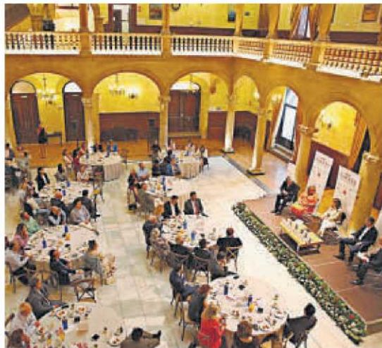
Notable afluencia en el Casino de Salamanca.