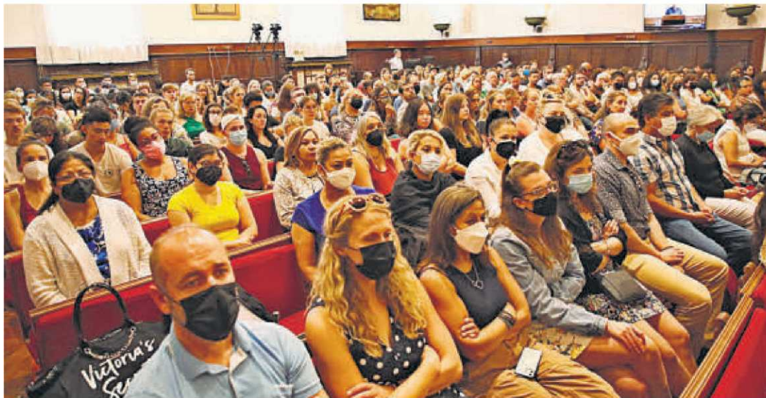
El Parainfo completamente lleno durante el acto de inauguración de los cursos de verano de español para extranjeros de la Universidad