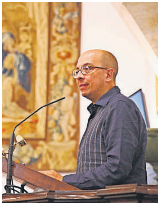
Jorge Volpi, durante su conferencia en el Paraninfo.

—Se acaba de asentar en España para dirigir el Centro de Estudios Mexicanos en España, ¿la colaboración del Estudio salmantino y la Universidad Nacional Autónoma de México va más allá del español, no?