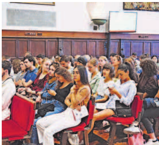
Estudiantes Erasmus en el Paraninfo el pasado miércoles.