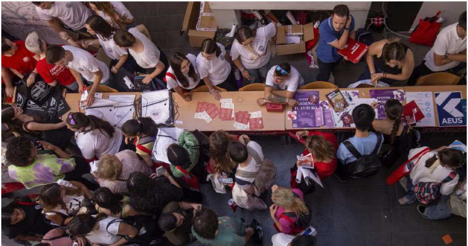
Los alumnos del campus de la USAL se acercaron a las mesas informativas que se instalaron en la Escuela Politécnica Superior.